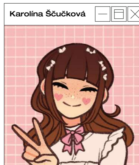
Hlavní Grafik Šéfredaktor

https://medium.com/yardcouch-com/the-dark-side-of-youtube-hidden-in-the-search-9a03ad37842c https://gingerweb.jp/timeless/person/article/20230128-imma https://www.podcastroku.cz/ https://www.ceskatelevize.cz/porady/14191464239-na-zachodcich/ https://picrew.me/en/image_maker/257476